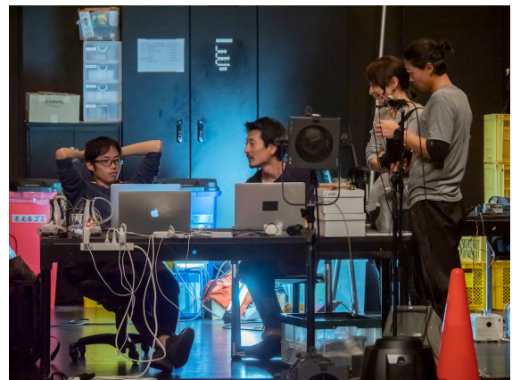
YCAM InterLab