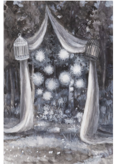
展覧会メインビジュアル 大人倫菜「Her night dreams」2019年

展覧会ウェブサイト https://ikiruwatashi.jimdosite.com/